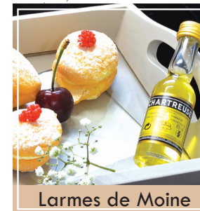
Larmes de Moine