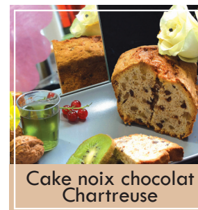
Cake noix chocolat Chartreuse