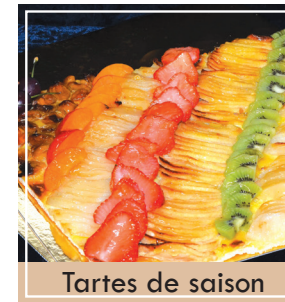
Tartes de saison